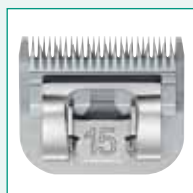
GT326 #15 3/64" | 1,2 mm