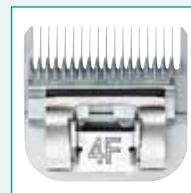
GT364 #4F 3/8" | 9,5 mm

Des Weiteren sind erhältlich: Klicken Sie auf die Scherköpfe für weitere Infos