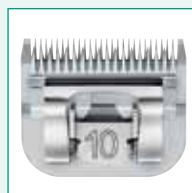
GT330 #10 1/16" | 1,5 mm