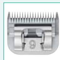
GT333 #9 5/64" | 2,0 mm