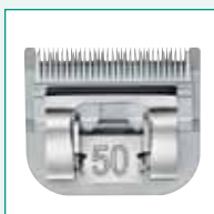
GT305 #50 1/125" | 0,2 mm