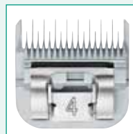
GT366 #4 3/8" | 9,5 mm