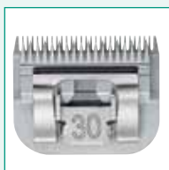
GT317 #30 1/50" | 0,5 mm