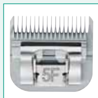
GT360 #5F 1/4" | 6,3 mm