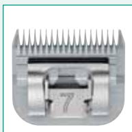
GT343 #7 1/8" | 3,2 mm