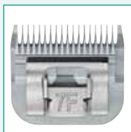
GT345 #7F 1/8" | 3,2 mm