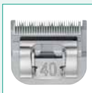
GT310 #40 1/100" | 0,25 mm